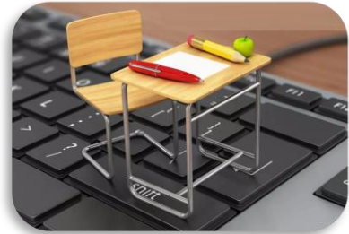
آزمون های الکترونیک و هوشمند