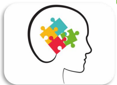
آزمون سازی و روانسنجی