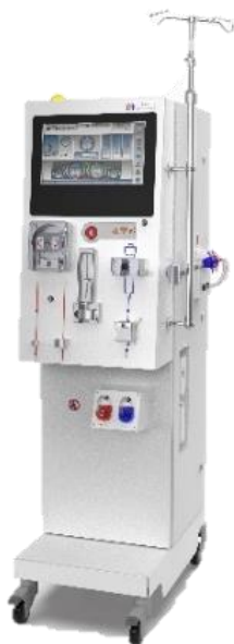
شکل ۲. نمایی از یک دستگاه همودیالیز